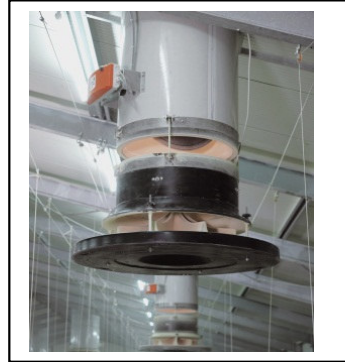
Zuluftkamin für Gleich- oder Überdrucklüftung