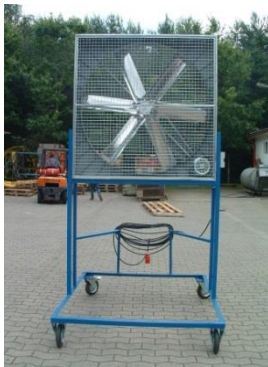
Beispiel eines mobilen Stützluftventilators

Ein natürlich gelüfteter Stall ist mit einer wärmedämmenden Schicht direkt unter dem Dach sowie Licht- und Luftbändern an den Stallaußenwänden ausgestattet. Bei diesen Stalltypen kann es sich auch um Mobilställe handeln. Zu beachten ist, dass sich beim Auftreten von Temperaturspitzen im Sommer die Stallinnen- und die Außentemperatur soweit angleichen können, dass der Effekt des thermischen Auftriebes nicht mehr gegeben ist. Bereits bei zu erwartenden Enthalpiewerten von bis zu 67 kJ / kg Außenluft müssen für die Tiere zusätzliche Maßnahmen (Abluft/Umluft) getroffen werden, um die körpereigene Wärme abzuführen. Hierbei kann es sich auch um mobile Ab-/Umluftsysteme handeln.