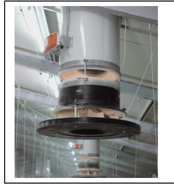
Zuluftkamin für Gleich- oder Überdrucklüftung