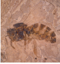
Versteinerte Honigbiene aus Rott

die älteste versteinerte Honigbiene 25 Mio. Jahre alt ist ?